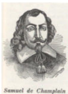
Samuel de Champlain

Nous avons aussi le témoignage de Samuel de Champlain qui, le 7 juin 1611, remonta la rivière Saint-Jacques – limite actuelle entre la ville de La Prairie et celle de Brossard – jusqu'au bassin de Chambly : « Elle est fort plaisante, y ayant plus de trois lieues de circuit de prairies et force terres qui se peuvent labourer ». ( Les Communes , par Élisée Choquet ptre, p. 76)