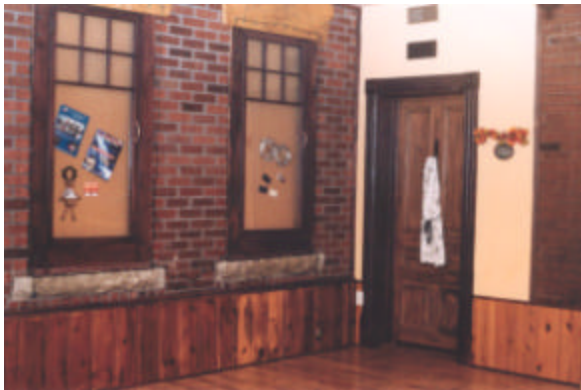
Hôtel De Montigny (actuel) – Salle Le Patriote

de passer aux actes. Dans ces circonstances, il arrivait à Albina de se charger du maintien de l'ordre en tentant de faire comprendre à certains petits groupes trop éméchés de retrouver leur calme. Arrivant dans la salle avant de l'hôtel où ces scènes se passaient, elle se plaçait près du poêle destiné à chauffer la pièce. D'une voix impérieuse elle ordonnait aux excités de se tranquilliser, sinon, de prendre la porte. L'avertissement n'était pas nécessairement reçu d'emblée comme il aurait convenu. La patronne se voyait rétorquer de se mêler de ses affaires tout en s'entendant invectiver de surnoms malséants.