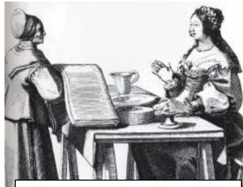
Gravure Jean-Baptiste Poilly - (détail)

Donc si vous ou certaines de vos connaissances disposez de pareils objets textiles faits à la main et en bon état, datant du XIX e ou du XX e siècle ou plus ancien, ou des accessoires servant à la confection de ceux-ci, nous serions intéressés à les emprunter pour les faire connaître. Que ce soit des nappes, des draps, des serviettes brodées, des dentelles, des parures au crochet, des courtepoinètes, des couvertures ou autres textiles tissés, des travaux de couture, des boîtes à ouvrage, des cerceaux à broder, des patrons, bref tout ce qui a trait aux linges de maison et à leur confection et même le coffre lui-même, s'il vous plaît, veuillez communiquer avec Paul Racine avant le 31 mars 2005.